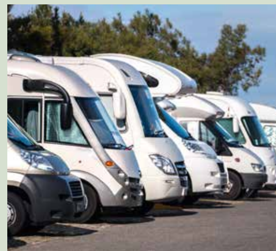
Auch im Handel hilft eine intelligente Stellplatzverwaltung Kosten zu sparen.