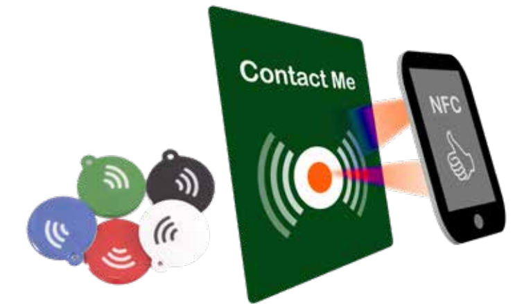
NFC-Chips in unterschiedlichen Größen und farbigen Aufdrucken.

NFC (= Near Field Communication) und RFID (= Radio Frequency Identification) sind beides Technologien, um über magnetische Funkwellen Informationen/Daten berührungslos zu übertragen.