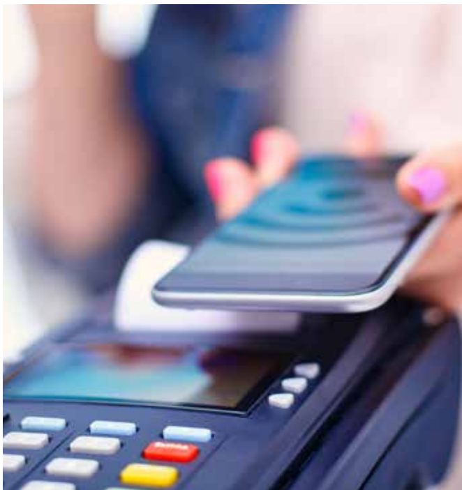
Kontaktlose Bezahlung mittels RFID bzw. NFC

NFC ist ein internationaler Übertragungsstandard, mit dem sich Daten über kurze Distanzen drahtlos mit einer Datenübertragungsrate von max. 424 kBits/s austauschen lassen. Diese reicht aus, um kleine Datenmengen in Sekundenbruchteilen zu übertragen. Die standardisierte Frequenz für NFC beträgt 13,56 MHz.